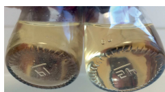
Observation visuelle du témoin et du vin après décongélation.

Au laboratoire, le test de tenue au froid est réalisé par mesure de la différence de teneur en acide tartrique et d'acidité totale entre deux échantillons de 50 mL : l'un placé au congélateur à -18^{\circ}C pendant 12H et un témoin conservé à température ambiante. Ces mesures sont complétées par une observation visuelle du dépôt formé sur l'échantillon après décongélation. Cette observation permet également d'évaluer la stabilité de la matière colorante.